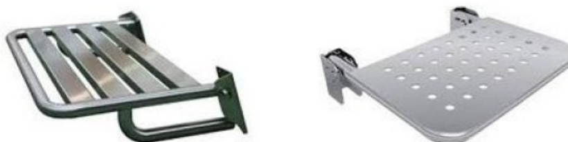
Figura 01 - Modelo de bancos articulados